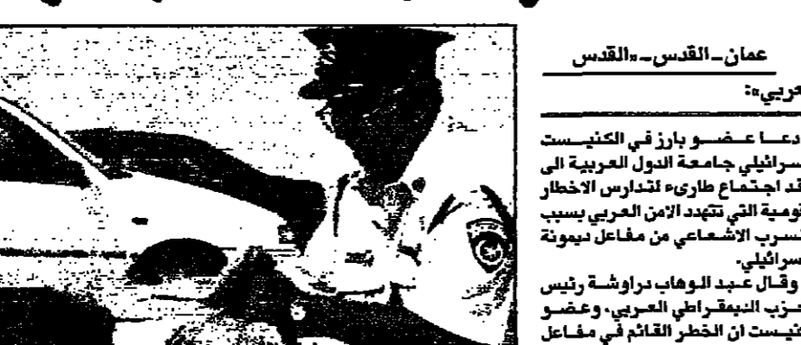
جندي اسرائيلي يعقل ناشطا ساعضا لتسليح النووي

كان حاول مع مجموعة من المتظاهرين للدخول إلى منطقة ديمونة